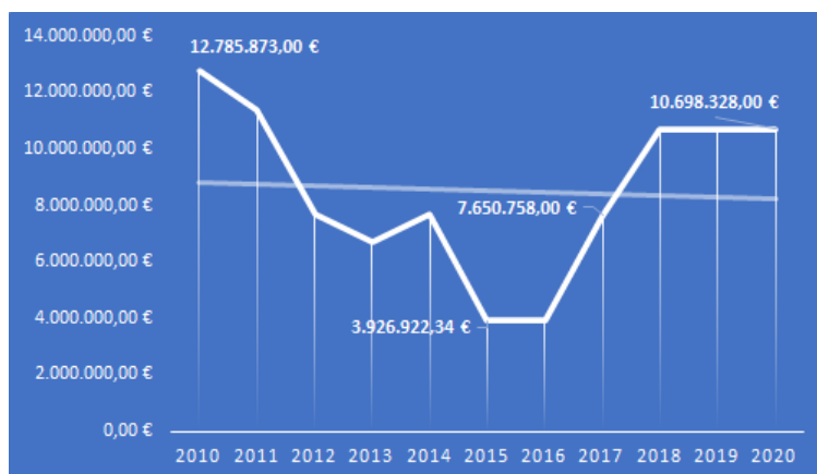
Figura 2 Orçamento da DGArtes para as artes performativas 2010–2020

Nota. Em milhões de euros, valores aproximados a partir de dados apresentados nos relatórios da DGArtes (DGArtes, 2012, 2014, 2015, 2017, 2018c, 2019; Santos & Ricardo, 2013). O orçamento do segmento “circo” e “artes da rua” está incluso apenas a partir de 2018