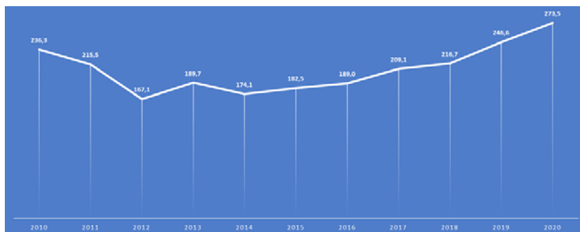
Figura 1 Orçamento do Ministério da Cultura 2010–2020

Na atualidade, Portugal conta com um Ministério da Cultura (MC) autónomo, cujo orçamento em 2020 foi de 523.400.000 €. Deste montante, 273.500.000 € são destinados para a cultura de fato, sendo os demais 249.800.000 € para a comunicação social (República Portuguesa, 2020, p. 11). Na Figura 1, abaixo, apresenta-se a progressão orçamentária 2 do MC nos últimos 10 anos.