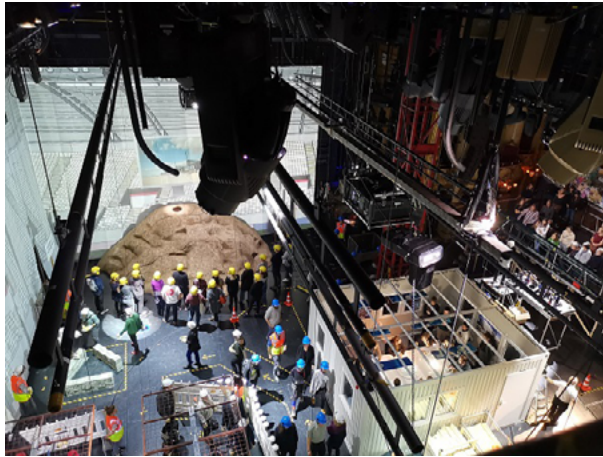
Figura 9: Participação em Society Under Construction por Rimini Protokoll, na "Trienal de Arquitetura de Oslo" de 2019| perspectivas da estação Transparency International