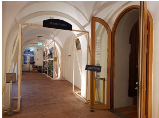
Figura 2: Entrada na área de Collections e Reading Room

(2019-09-25 a 29, Oslo)