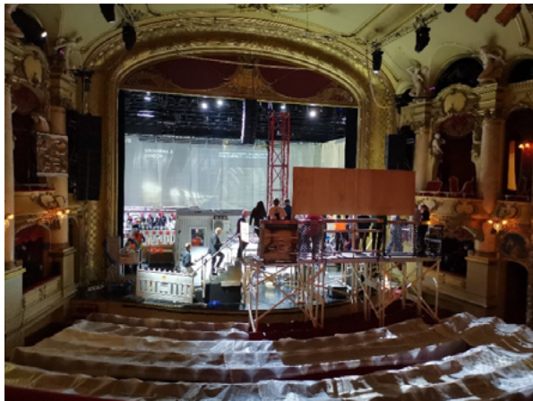
Figura 10: Pest Control