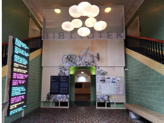
Figura 1: Foyer de entrada no Arkitekturmuseum (Museu Nacional de Arquitetura de Oslo), venue da “Trienal de Arquitetura de Oslo” de 2019 para a secção expositiva “The Library”

museu encarnou a “personagem”, expandindo a área de cafetaria como zona informal de leitura e de realização de encontros ou reuniões.