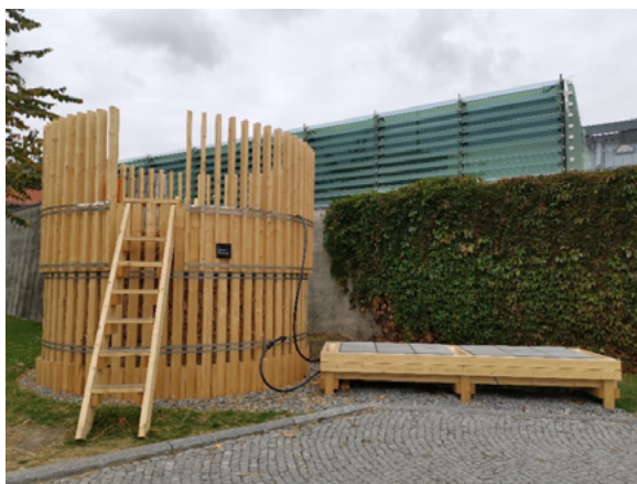
Figura 3: Projeto Power Plant! na ala exterior sul do edifício

edição da trienal: Power Plant! (Figura 3). Na zona verde situada na ala sudoeste externa ao edifício, disponibilizado como espaço de fruição pública, este protótipo – resultante de um “ato coletivo” (Flakk/Dalziel Arkitektur) entre estudantes da AHO-The Oslo School of Architecture orientados por Tom Dobson (do coletivo Public Works) e Matthew Denziel – estabelecia-se com um sistema integrado de pretensões performativas, sendo composto por duas peças de estrutura em madeira. Ligada à imponente peça cilíndrica (a funcionar como depósito de compostagem a partir do lixo orgânico da cidade), um banco reage aquecendo por simbiose do processo resultante da compostagem. No conjunto, este objeto-construído simula-se como um objeto-orgânico, apresenta-se como uma “planta” com potencial transformador para a arquitetura, numa performance que se coaduna com o espírito de Degrowth .