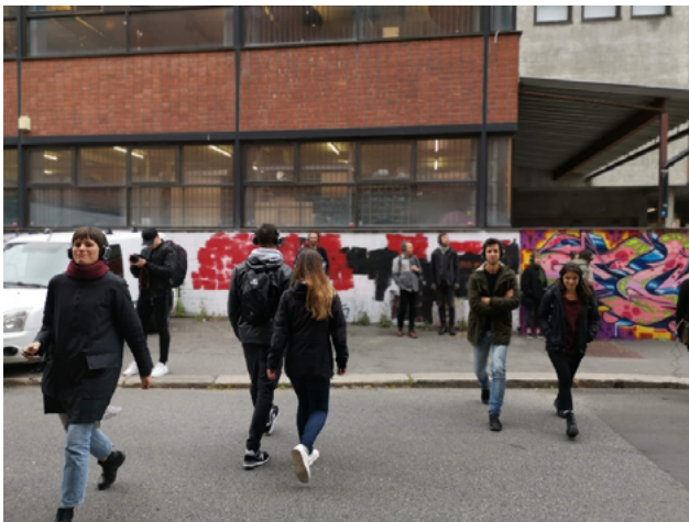
Figura 6: Spot Opinion Poll