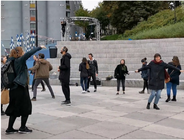
Figura 5: Participação no projeto Place Listening , da "Trienal de Arquitetura de Oslo" de 2019 para a secção expositiva "The Playground"