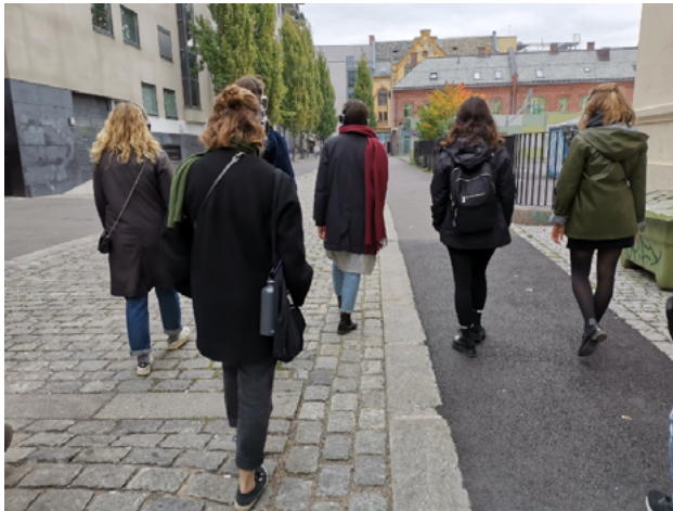
Figura 8: a Caminho do spot Play On Display