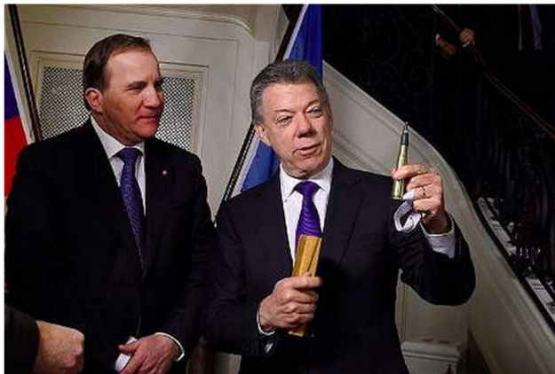
Bogotá, Dec 12 (Prensa Latina) Nobel Museum in Stockholm will treasure the emblem of peace used by president Juan Manuel Santos during the talks with the FARC-EP guerrilla and the ballpen used to sign the main agreements, confirmed today the Casa de Nariño (government headquarters).

Figure 8: El Balígrafo es ahora parte del Museo Nobel, como símbolo de paz