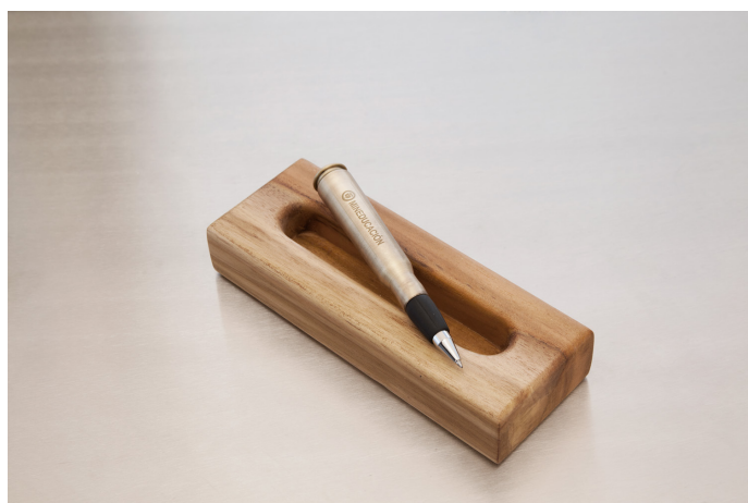
Figura 1: El Balígrafo

Las balas fueron transformadas en bolígrafos (Figura 1) y entregados por el Ministerio de Educación, como correo directo, a 500 periodistas, escritores y personas influyentes, no solo en Colombia sino en toda de la región y el mundo.