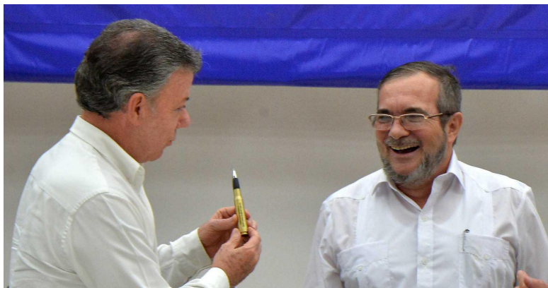
Figura 2: El presidente de Colombia, Juan Manuel Santos, ofrece el Balígrafo al antiguo líder y Comandante de las FARC, Timolón Jiménez (Timochenko)

Cuando terminaron las negociaciones finales, el Presidente quería mostrar al mundo que su apoyo había sido crucial para poner fin a la guerra civil más antigua del continente. Es por eso el acuerdo de paz final, el que asumió en la ONU, se firmó en vivo con el Balígrafo y se emitió en todo el mundo (Figures 2, 3 y 4). Después de un referéndum, hubo que hacer algunos ajustes en el documento, por lo que se necesitaba una segunda ceremonia de firma en el Teatro Colón en Bogotá, Colombia, y nuevamente, el presidente exigió que se firmara el segundo acuerdo con el Balígrafo.