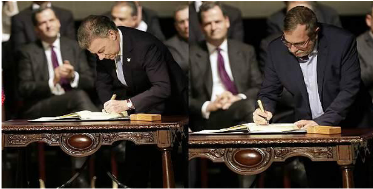
Figura 3: El Acuerdo de paz firmado con el Balígrafo