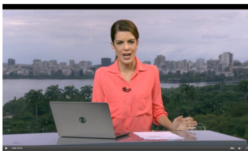
Figura 2: Estúdio RJTV

Curioso perceber os contrastes de representações neste momento, já que o “cenário Zona Sul” do estúdio é utilizado para convocar VT realizados prioritariamente em regiões “extra-zona sul” (Duque de Caxias, Belford Roxo, Madureira, Grajaú). O estúdio em Brasília, da EBC e o estúdio carioca, da Rede Globo operam, cada qual a seu modo, com silenciamentos discursivos: enquanto os profissionais brasilienses optam pela ausência de representações imagéticas urbanas – de Brasília ou da região a que se refere cada VT –, o estúdio carioca opera com a assincronia, já que a cidade do estúdio não é aquela que se calou para aparecer em seguida nas produções dos amadores. Passando para os assuntos tratados pelos repórteres-testemunhas: das 20 produções analisadas, em 60% de cada um dos dois quadros, o “mercado de problemas sociais” domina o discurso do período em questão pauta-se, prioritariamente, em mazelas, sobretudo problemas na infra-estrutura urbana.