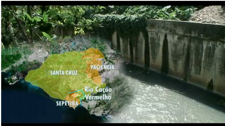
Figuras 4, 5 e 6: Frames da matéria “Moradores denunciam situação do Rio Cação Vermelho” (Parceiro RJ- 05/05/14)

A matéria “Moradores denunciam situação do Rio Cação Vermelho” (05/05/14) exemplifica o esquema acima apresentado. Nela, os “Parceiros do RJ” do Bairro Santa Cruz, Mano Brasil e Alessandro Werneck vão, a pedido dos moradores, ao Bairro de Paciência analisar os problemas causados