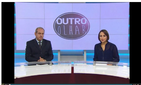
Figura 1: Estúdio R.Brasil