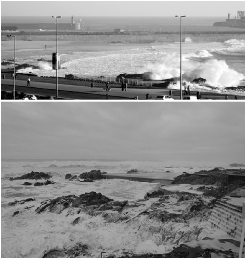
Figura 6: Piscina das Marés

Visto da minha janela, na paisagem, o pequeno espelho de água do tanque principal da Piscina das Marés parece ridículo face ao vasto oceano que o circunda; mas é suficiente para servir a sua função balnear, mercê da organização que lhe proporcionam os seus muros de betão, articulados com os rochedos pré-existentes.