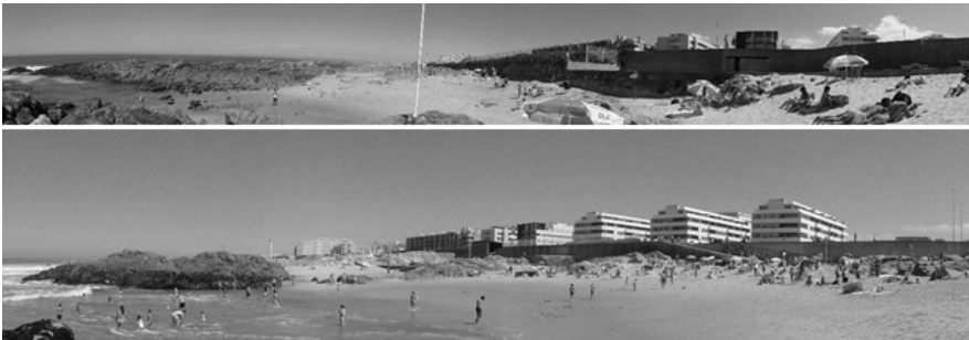
Figura 5: Vista da praia, a norte e a sul da Piscina das Marés

Até porque, quando observamos o edifício dos balneários a alguma distância, do lado da praia ou da piscina, já não o vemos; vemos apenas um muro, um paredão com cerca de quilómetro e meio; uma grande linha reta que começa muito antes e acaba muito depois do sítio onde sabemos estar o edifício.