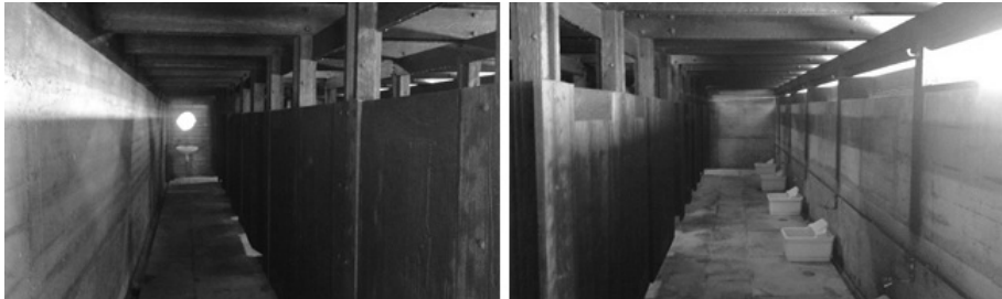
Figura 3: Piscina das Marés: corredores a nascente e poente das cabines do balneário masculino. Créditos: Eduardo Fernandes

Descemos; ao entrar nos vestiários, sentimos que penetramos no paredão pré-existente: é um lugar escuro, um espaço denso, entre duas paredes de betão; o interior é dominado por uma mancha negra, as cabines individuais, construídas em madeira de Riga escurecida com óleo queimado, tal como o teto e as vigas da cobertura.