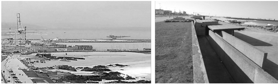
Figura 1: Piscina das Marés: vista de longe (do farol de Leça da Palmeira) e de perto

o edifício fica “ancorado, como um barco, no muro da marginal” (Siza, 1980, p. 23). Construído à cota da praia, com pés-direitos interiores baixos e inclinações muito suaves na cobertura, o volume dos balneários torna-se quase impercetível quer ao longe, na paisagem, quer de perto, à cota da estrada marginal.