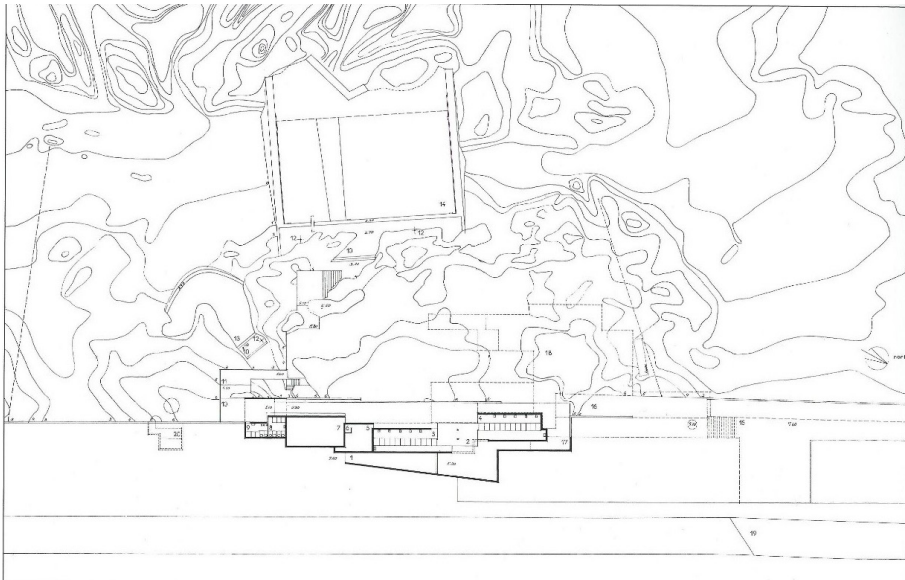
Figura 2: Planta do projeto de instalação da piscina (1962 – 65), não datada Desenho de Álvaro Siza