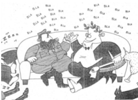
Los humoristas gráficos recogieron la visita de Fraga a Cuba.