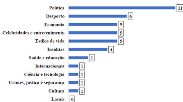
Gráfico 1: Temáticas noticiosas que não suscitam interesse (N= 29)

Esta situação foi observada, em particular, num exercício que tinha como objetivo perceber o modo como os participantes gerem a informação que encontram nas redes sociais. Ao serem apresentadas publicações da página de Facebook de diversos websites noticiosos relativas ao apagão de 10 de março na Venezuela, verificou-se, na totalidade do primeiro grupo de foco (apesar de na Venezuela residir uma importante comunidade de imigrantes madeirenses) e em dois membros do segundo, uma falta de interesse relativamente a este tipo de notícias. Por um lado, os participantes indicam que os eventos nelas descritos não têm um impacto direto nas suas vidas e não sentem motivação para consumi-las. Por outro, os jovens afirmam que a saturação da cobertura jornalística deste tipo de situações fá-los perder o interesse.