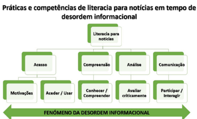
Figura 2: Modelo de análise

Com base nos conceitos destacados na revisão de literatura, foi traçado um modelo de análise 2 representado na Figura 2, que foi mobilizado nos dois instrumentos de pesquisa empírica. Esse modelo combina a conceptualização de literacia para notícias atrás mencionada com o enquadramento teórico do fenómeno da desordem informacional (Wardle & Derakhshan, 2017).