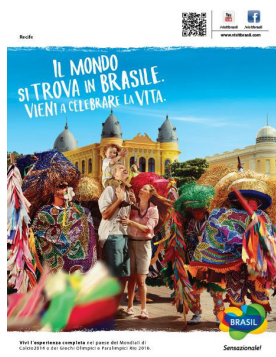
Figura 2: Anúncio Recife

Partimos agora para a descrição e análise de um anúncio da referida campanha, que retrata o cenário do carnaval na cidade de Recife, no estado de Pernambuco, conforme pode ser visto a seguir.