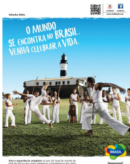
Figura 4: Anúncio Salvador