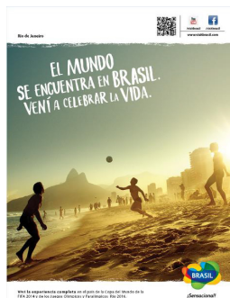
Figura 3: Anúncio Rio de Janeiro

Seguimos para o próximo anúncio, cujo cenário em destaque é uma praia na cidade do Rio de Janeiro.