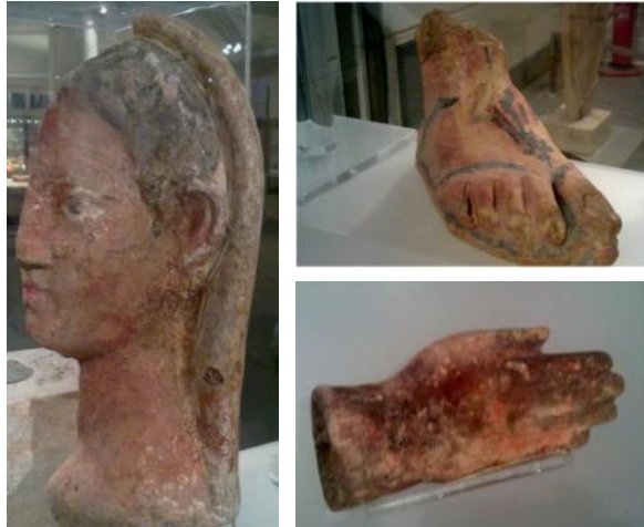
Figura 1: Ex-votos do antigo Templo de Asclépio. Esculturas em terracota. Cabeça de mulher, pé e mão. Museu Nacional Romano.

encontrados no antigo templo e expostos no Museu Nacional Romano, localizado nos antigos Banhos de Diocleciano, em Roma, na Itália.