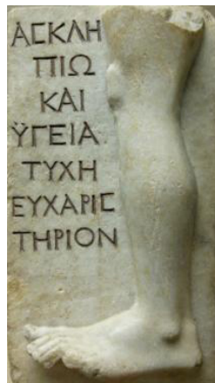
Figura 2: Ex-voto dedicado a Esculápio, c. 100–200 a.C. Relevô em mármore. 30,48 x 20,32 cm. Inscrição: Tyche (oferece isto) para Esculápio e Higéia como agradecimento