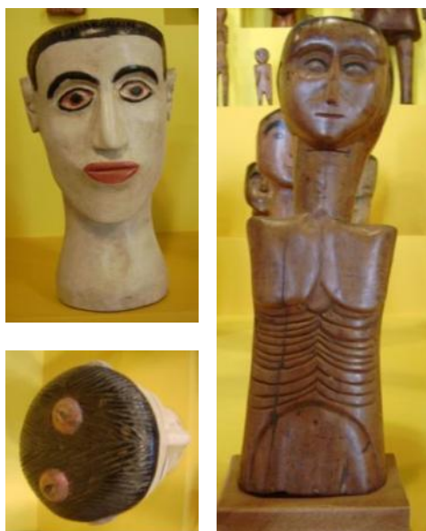
Figura 6: Ex-votos da Coleção Lina Bo Bardi Centro Cultural Solar Ferrão, Salvador, BA, Brasil