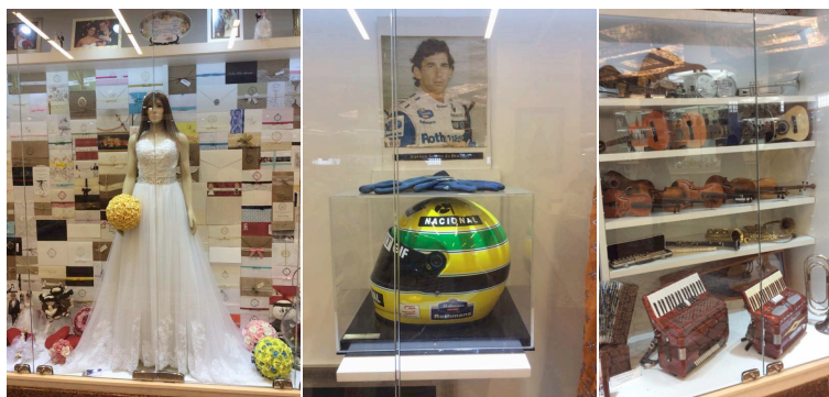
Figura 3: Objetos diversos, Santuário Aparecida, São Paulo, Brasil

da tecnologia, hoje são encontrados ex-votos eletrônicos, como CDs, DVDs, velas virtuais, emails e até SMSs encaminhados por celular exibidos em uma tela, como é o caso do Santuário da Aparecida, no estado de São Paulo, o maior santuário mariano em área e dos mais visitados do mundo. “Muita gente fica angustiada porque não tem como vir pagar a promessa. Agora pode agradecer por SMS”, explica o Padre Rodrigo Arnos, em entrevista à antropóloga Bianca Gonçalves de Souza publicada na revista Unesp-Ciência (Nogueira, 2011, pp. 36-41).