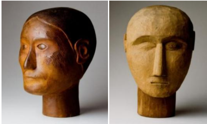
Figura 4: Ex-votos da Coleção Mário de Andrade IEB – Instituto de Estudos Brasileiros (USP-SP), Brasil

“Obras interessantíssimas esses milagres, alguns mesmo de grande beleza estética que os colocam em pé de igualdade com muita escultura tradicional, não só popular, mas das culturas primitivas” (Andrade citado em Batista, 2004, p. 56).