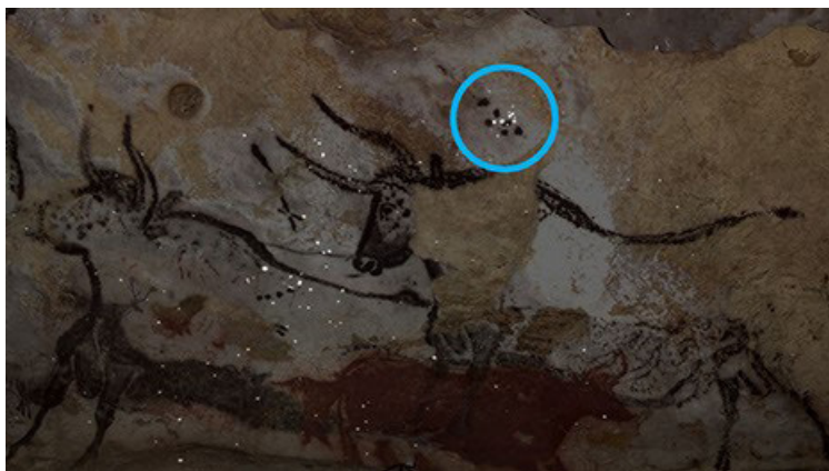
Figura 1: Pintura com cerca de 12 mil anos na caverna de Lascaux, França. No círculo azul podemos observar uma representação do enxame de estrelas designado de Plêiades

Nesta história, começamos a olhar para o céu e a encontrar padrões que nos permitiram contar os tempos e as estações, fazendo do céu e da luz que nos chega dele, um calendário e um relógio, mas também um mapa (Figuras 1, 2 e 3). Com esse conhecimento a Humanidade passou a cultivar a terra, a contar o tempo e a navegar os mares.