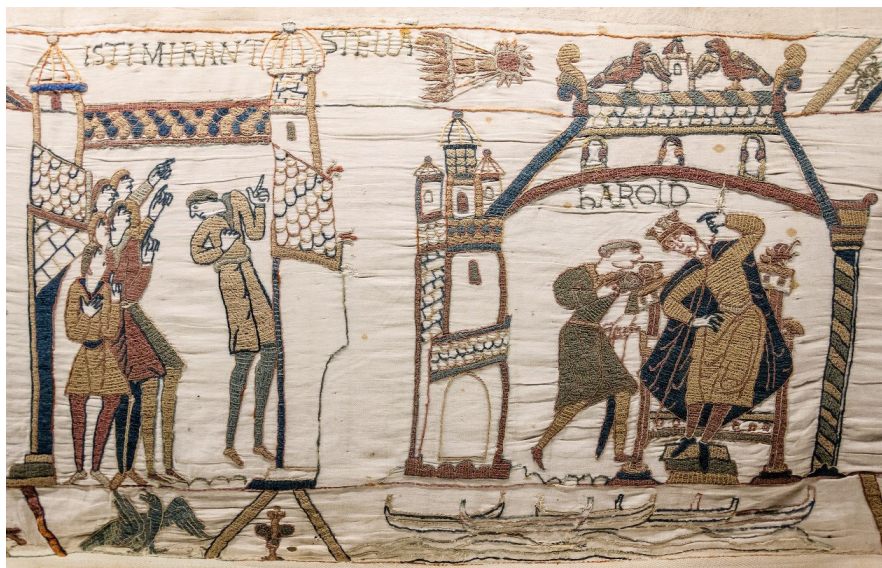
Figura 2: Tapeçaria de Bayeux com eventos da Batalha de Hastings, em 1066. Nela podemos ver uma representação da passagem de um Cometa como sinal de mau augúrio